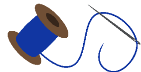
Garn und Nadel oder Schaschlikspieß